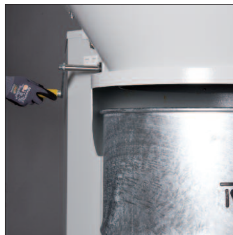
Exakte Anpassung an die jeweilige Abscheide-Einheit