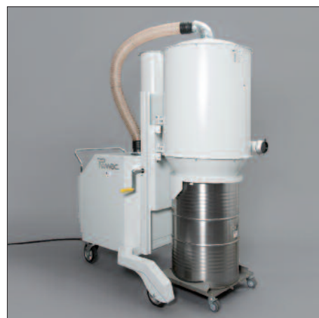
200 Liter-Fass mit Fahrwagen