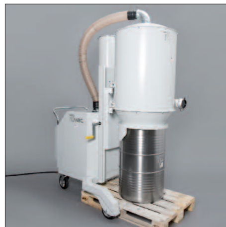
200 Liter-Fass auf Europalette