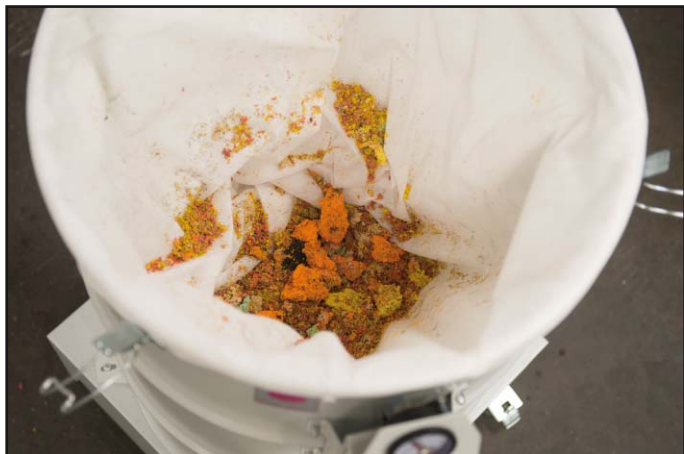
Сбор обрезков в холстяной мешок

Промышленные вытяжки серии DAV-SB используются для сбора концов нитей и других видов обрезков (например, бумаги, пластика, ткани) на производстве. Производительность, конструкция и размеры адаптированы под производственные системы, в которых они применяются. Обрезки помещаются в мешок фильтра, принадлежащий к классу М. Таким образом, собранный материал оседает в хорошо сжатом виде, что позволяет оптимально использовать объем фильтра. Заполненный фильтр извлекается из вытяжки достаточно просто.