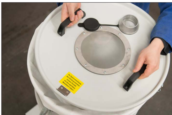
Простая замена фильтра путем снятия крышки